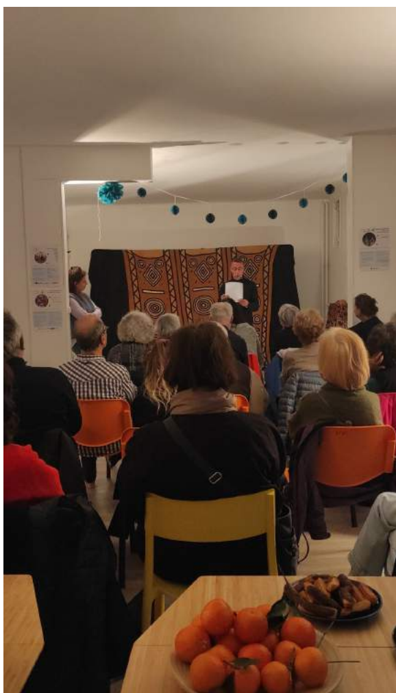
Présentation projet rien qu'un pont - 16 novembre 2023 - Antenne petits frères des pauvres