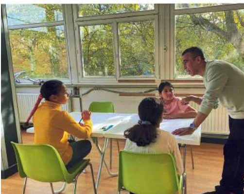
Stage Artistique - Toussaint 2023 - Centre Maurice Ravel

Le 17 novembre 2023, une fête a réuni tous les participants du projet, évènement lors duquel les enfants ont lu les textes. Les enregistrements ont été écoutés et une exposition a permis de les lire.