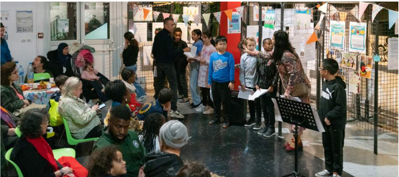
Fête Rien qu'un Pont - 17 novembre 2023 - Centre Paris Anim' Maurice Ravel