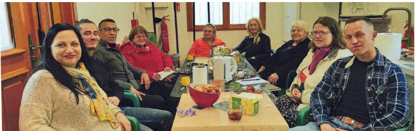
P'tit dej culturel seniors - 10 mai 2023 - À la cabane du centre Paris Anim' Maurice Ravel

Le soutien de notre partenaire, le Centre Paris Anim' Maurice Ravel, nous a permis dans un premier temps, grâce à ses petits déjeuners de quartier, de rencontrer différentes personnes âgées des environs avec qui nous avons pu discuter, échanger et exposer notre projet.