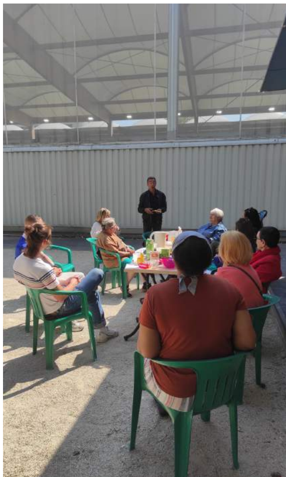
P'tit dej culture seniors - 10 juin 2023 - Centre Paris Anim' Maurice Ravel