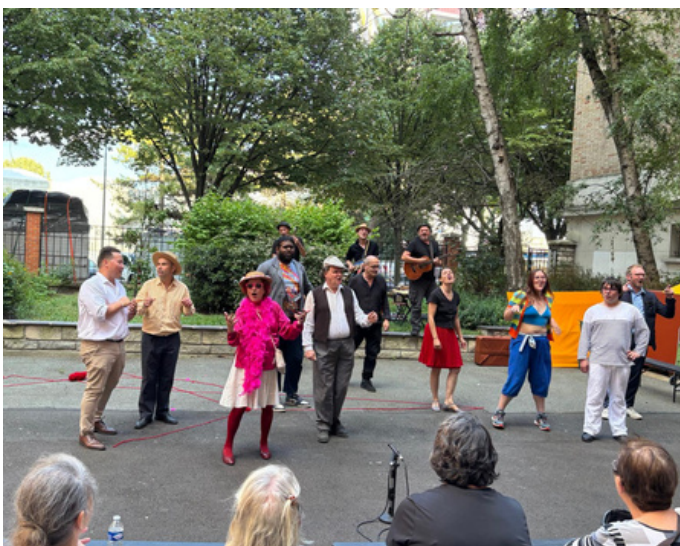
Représentation au 64 Boulevard Solt le 10 juillet 2025