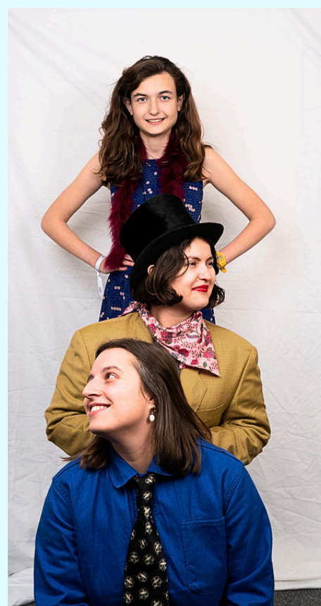
Le studio photo : un renforcement des liens intergénérationnels