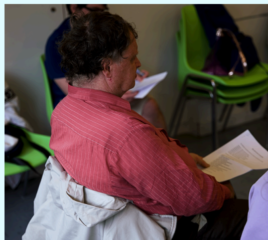
Répétition au centre Maurice Ravel

La dernière étape du projet et son point d'orgue a consisté à de l'écriture au plateau, des répétitions et des représentations du spectacle Entre deux ponts dans les cours d'immeuble du quartier.