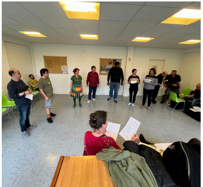
Répétition au centre Maurice Ravel