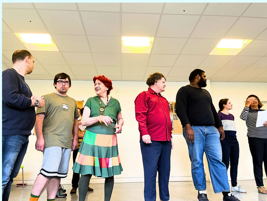
Répétition au centre Maurice Ravel